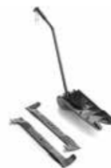
17. Mulcs kit (dugó és kés) Cikkszám: 299900076/0