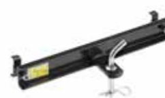
28. Vonóhorogkészlet Cikkszám: 299900385/0