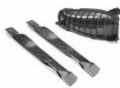
18. Mulcs kit (dugó és kés) Cikkszám: 210330000/17