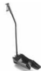
3. Mulcs kit (csak dugó) Cikkszám: 210205000/19