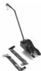
16. Mulcs kit (dugó és kés) Cikkszám: 299900074/0