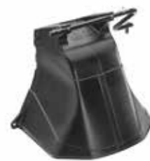
1. Hátsó deflektor Cikkszám: 299900310/0