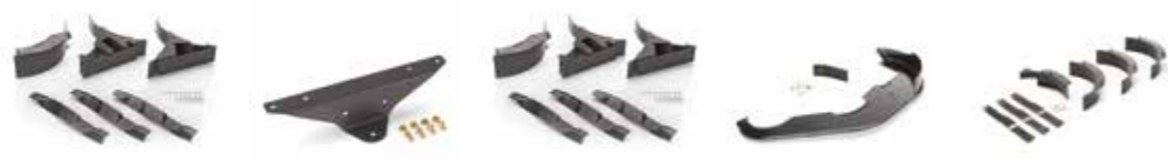
1. ZTR 7132 mulcs kit (késekkel) 2. Vonóhorog ZTR 42 3. Vonóhorog ZTR 7132 4. Mulching kit 5. ZTR 5132 mulcs kit (beleértve a késeket)