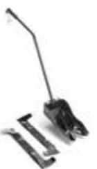
19. Mulcs kit (dugó és kés) Cikkszám: 299901074/0