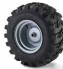
37. 18" hátsó téligumi felnível párban Cikkszám: 299900430/0