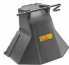
2. Hátsó deflektor Cikkszám: 299900016/0