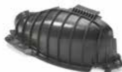
5. Mulching kit (plug) Cikkszám: 299900341/0