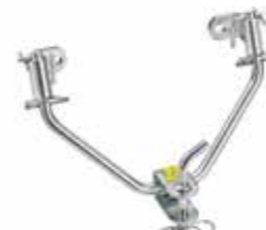
27. Vonóhorogkészlet Cikkszám: 299901006/0