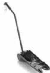
10. Mulcs kit (csak dugó) Cikkszám: 299900046/0