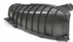
6. Mulcs kit (csak dugó) Cikkszám: 299900346/0