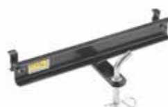
24. Vonóhorogkészlet Cikkszám: 299900395/0