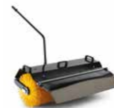
41. Forgókefe 105 cm (PTO KIT szükséges) Cikkszám: 299900500/1