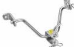
25. Vonóhorogkészlet Cikkszám: 299900006/0