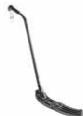
8. Mulcs kit (csak dugó) Cikkszám: 299900036/0