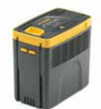
48. Stiga akkumulátor E 475 (48V, 7,5Ah) Cikkszám: 277017008/ST1