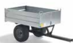
30. Utánfutó proif galvanizált Cikkszám: 13-3906-11