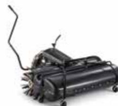
42. Seprőgép (gyűjtővel) (PTO KIT szükséges) Cikkszám: 211200100/17