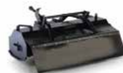
44. magasgvágó 105 cm (PTO KIT szükséges) Cikkszám: 299900540/0