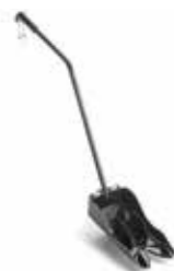
11. Mulcs kit (csak dugó) Cikkszám: 299901055/0