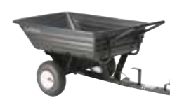
29. Utánfutó műanyag kombinált Cikkszám: 13-0952-11