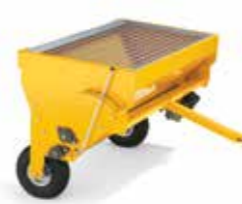
33. Kő, homok, sósózóró Cikkszám: 13-1975-14