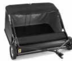
31. Fű és levélgyűjtő 42" compact Cikkszám: 2A6107010/S17