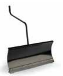
40. Hótoló 107 cm élvédő Cikkszám: 299903410/1