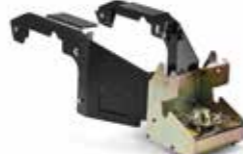
23. PTO KIT eszközhordozó Cikkszám: 211000100/17