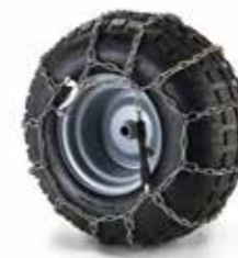
38. Hólánccs 18" Cikkszám: 299900470/1