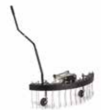
43. Gereblye 110 cm (PTO KIT szükséges) Cikkszám: 211900100/17