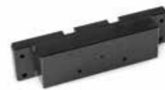
35. Kerék súly Cikkszám: 210900100/17