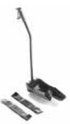
14. Mulcs kit (dugó és kés) Cikkszám: 299900370/1