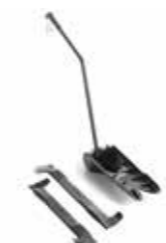
20. Mulcs kit (dugó és kés) Cikkszám: 299901077/0