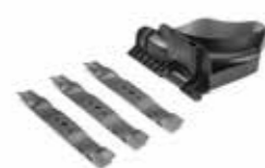
21. Mulcs kit (dugó és kés) Cikkszám: 210300000/17