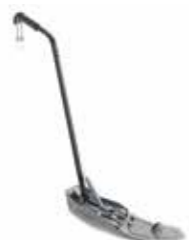
7. Mulcs kit (csak dugó) Cikkszám: 299900135/0