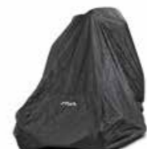
46. Stiga takaróponya Cikkszám: 1134-9177-01 STIGA