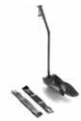
15. Mulcs kit (dugó és kés) Cikkszám: 299900374/0