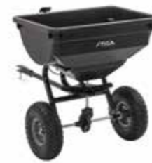
32. Műtrágyaszóró Cikkszám: 13-0955-11