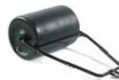
34. Henger 23" Cikkszám: 299900260/0