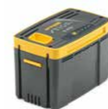
47. Stiga akkumulátor E 450 (48V, 5 Ah) Cikkszám: 277015008/ST1