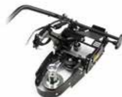
22. PTO KIT eszközhordozó Cikkszám: 299900750/1