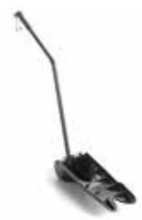
12. Mulcs kit (csak dugó) Cikkszám: 299901056/0