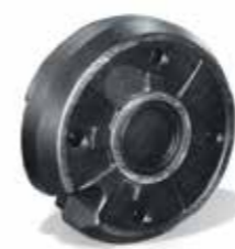
36. Kerék súly Cikkszám: 299900150/0