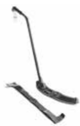
13. Mulcs kit (dugó és kés) Cikkszám: 299900037/0