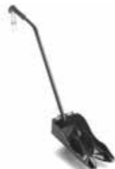
9. Mulcs kit (csak dugó) Cikkszám: 299900055/0